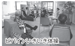
ピバインいきいき体操

当デイサービスでは、四季折々の創作活動、各種レクリエーション活動を通じ、充実した1日を過ごしていただけます。外出行事やイベントにはスタッフが同行していますので、安心して参加いただくことが出来ます。「楽しみ」と「生きがい」を見つけ、心身ともに健やかな毎日を送るお手伝いをいたします。