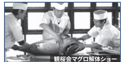
観桜会マグロ解体ショー