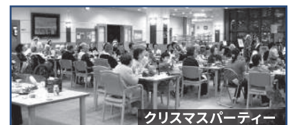
クリスマスパーティー