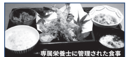
専属栄養士に管理された食事